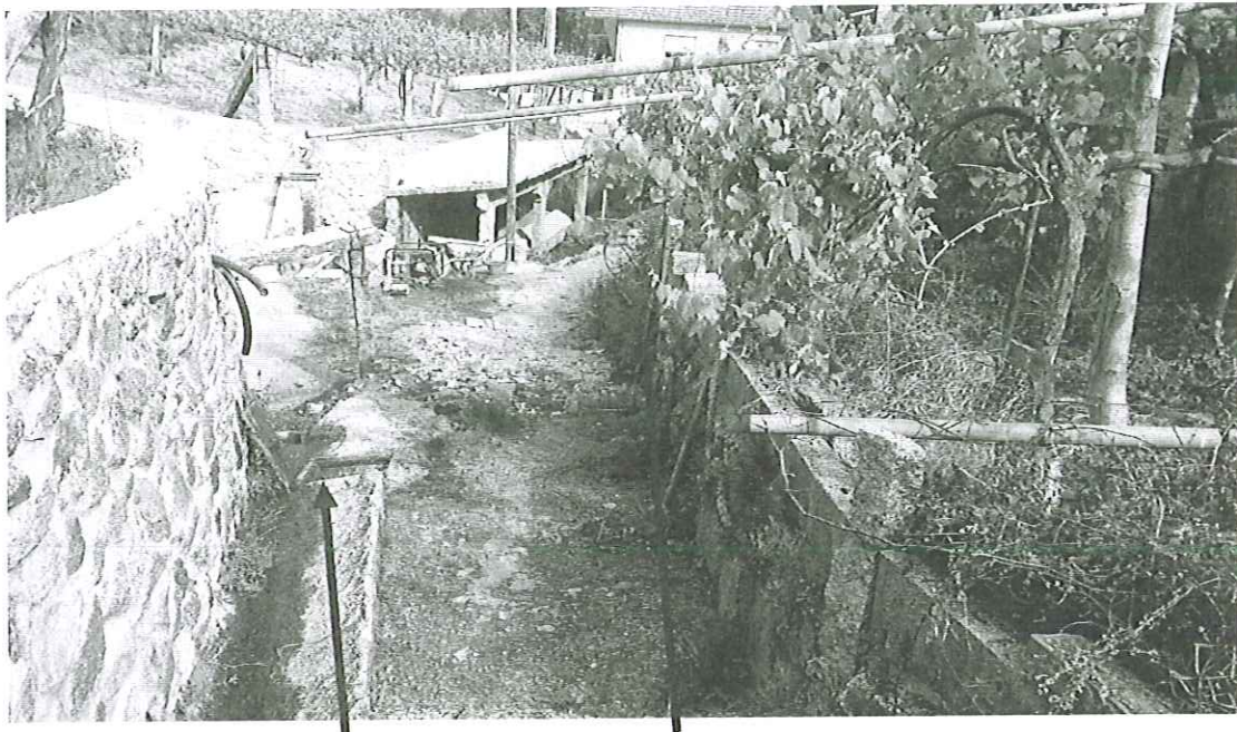
RED DE SANEAMIENTO

Por todo ello, concluyo que debe procederse a su retirada para evitar que cualquier persona resulte dañada a resultas de cualquiera de los elementos descritos que ocupan el camino público a la fuente y al lavadero.